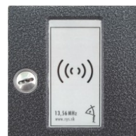
KARAT antika strieborná