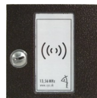
KARAT antika medená